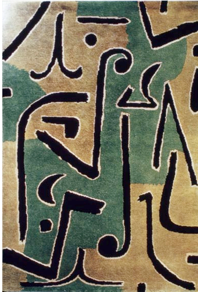
Paul Klee "Brins d'herbe", 230 x 150 cm, tapis laine point noué